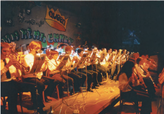
Concert Hits of the 90's