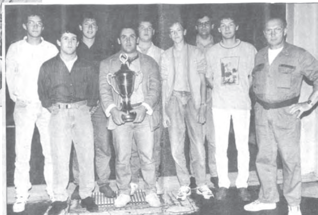
Die Siegermannschaft aus Bettendorf