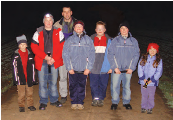
Stand Jugendpompjeeën 2005: