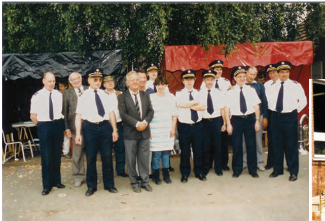
Den éischte Besuch vu Bettenduerf zu Bettendorf.

Mat Bettendorf bäi Aachen huet d'Pompjees-Musik zënter Joren eng enk Bezéiung. Eise Veräin war déi éischte Kéier de 14. Juni 1987 an Däitschland bäi hinnen op Besuch. Dat selwecht Joer, de 27. August, sinn eis däitsch Frënn eis besiche komm. No dem éischte Kontakt hu mir eis du iwwer d'Jore weg oft rëmgessin, siew dat an Däitschland oder hei am Duerf.